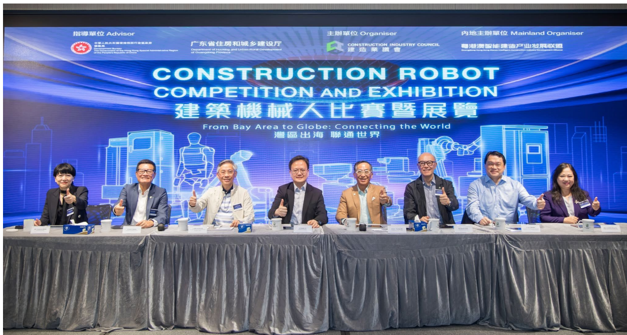
「建築機械人挑戰賽」評審團合照