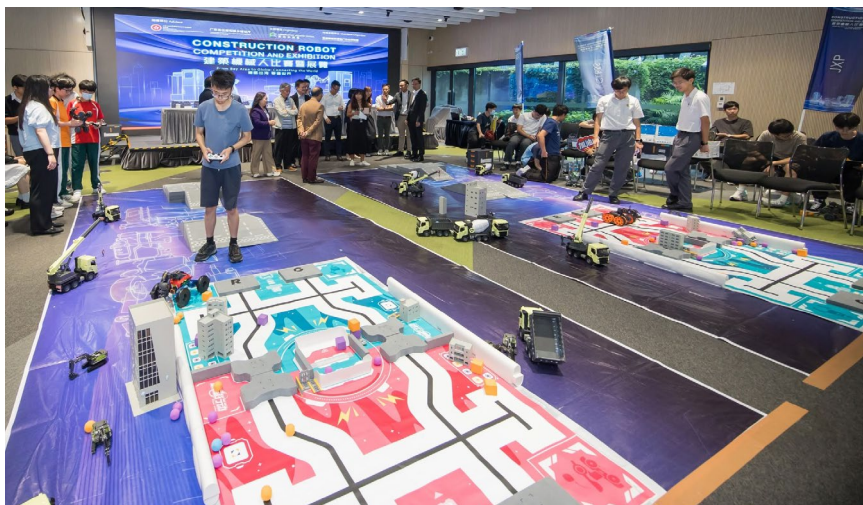
「建築機械人挑戰賽」現場