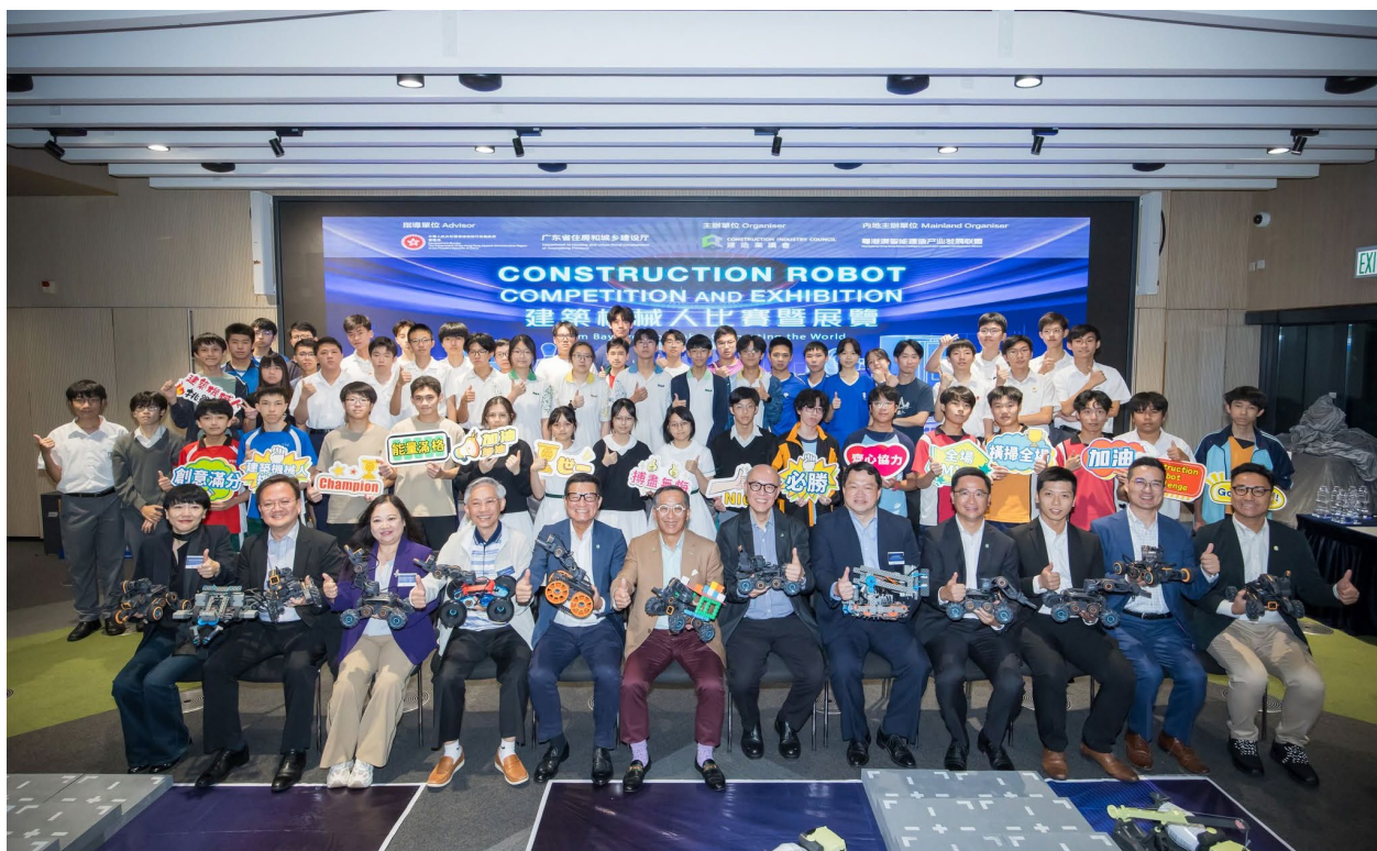
評審團與 12 支精英團隊於「建築機械人挑戰賽」合照