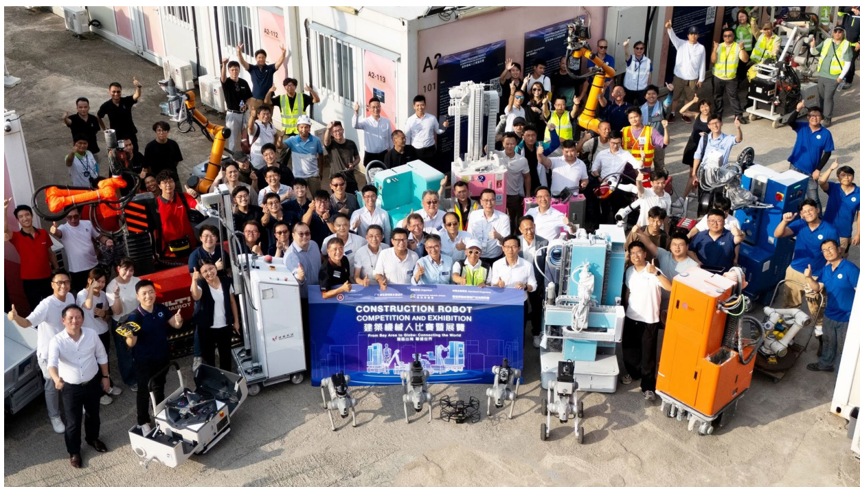
評審團與機械人公司於「建築機械人實戰比賽」合照